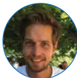
Meester Visscher groep 4 / 5