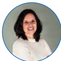
Juf Mosterd groep 3