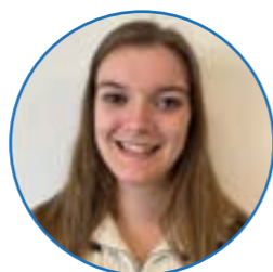
Juf Plette groep 6