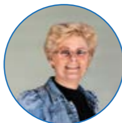
Juf Rorije groep 1 / 2