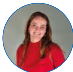
Juf Smienk groep 7 / 8